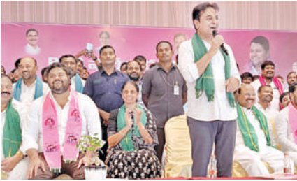
ఇబ్రహీంపట్నం బిఆర్ఎస్ పార్టీ సమావేశంలో మాట్లాడతున్న కెటిఆర్

అందోళన చేస్తున్న వారిని తలమి కొట్టిన పోలీసులు తీర్పు వచ్చేదాకా ఎగ్జామ్స్ వాయిదా వేయాల్సి డిమాండ్