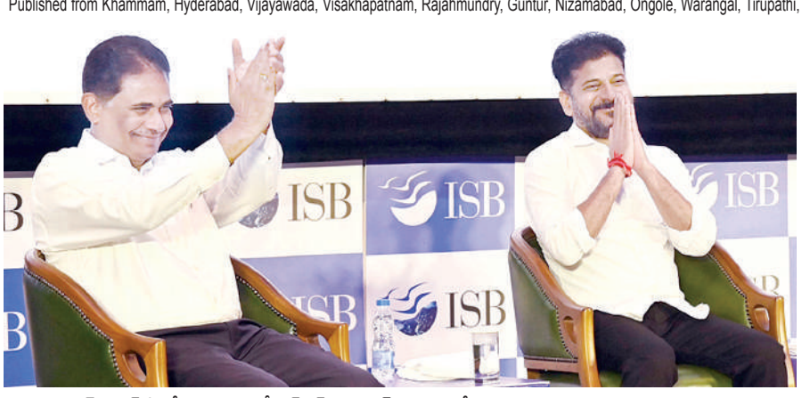
హైదరాబాద్ ఐఎన్ఐటిలో ఆదివారం లీడర్షిప్ సమ్మిట్-2024లో ఆదివారం చేస్తున్న ముఖ్యమంత్రి రేవంత్

హైదరాబాద్ (గచ్చిబౌలి), అక్టోబరు 20 ప్రభాతవార్త: తెలంగాణ రాష్ట్రాన్ని త్రిలియన్ డాలర్ ఎకానమిగా నిలుపడమే రాష్ట్ర ప్రభుత్వ లక్ష్యమని, ఈ లక్ష్యం సాధించాలంటే కీలకమైన హైదరాబాద్ నగరాన్ని 600బిలియన్ సిటీగా అభివృద్ధి చేయాల్సిన అవసరం ఉందని తెలంగాణ రాష్ట్ర ముఖ్యమంత్రి రేవంత్ రెడ్డి అన్నారు. జీవితంలో ఉన్నత లక్ష్యాలను చేరుకోవాలంటే కొంత రిస్క్ తీసుకోక తప్పదని, రిస్క్ తీసుకోకుండా లక్ష్యాలను చేరుకోలేమని అన్నారు. గచ్చిబౌలి లోని ఐఎన్ఐటి సూల్ అఫ్ బిజినెస్(ఐఎన్ఐటి)లో ఆదివారం నిర్వహించిన లీడర్షిప్ సమ్మిట్-2024లో ముఖ్యమంత్రి రేవంత్ రెడ్డి పాల్గొన్నారు. ఈ సందర్భంగా లీడర్షిప్ ఐన్ న్యూ ఇండియా అండ్ శంషై ముఖ్యమంత్రి ప్రసంగించారు. ఈ సందర్భంగా ఆయన మాట్లాడుతూ ఐఎన్ఐటి విద్యార్థులు తెలంగాణ ప్రాంతం అభివృద్ధికి, విద్యార్థులు ఇతర ప్రదేశాలకు వెళ్లినప్పుడు అక్కడే ఇన్ఫర్మేషన్, వ్యాపారవేత్తలు, ప్రజలతో తెలంగాణ, హైదరాబాద్ అభివృద్ధిపై చర్చించాలన్నారు. ఐఎన్ఐటి కలిసి పనిచేసేందుకు రాష్ట్ర ప్రభుత్వం చూస్తుందని, పెద్దమొత్తంలో వేతనాలు ఇవ్వలేకపోయినా, ఉత్తమ అవకాశాలను కల్పిస్తామని అన్నారు. తెలంగాణ దేశానికి అదర్బంగా నిలుపడమే తన లక్ష్యమని, తెలంగాణ ప్రజాకారులు ఒంటిపక్కలో గోల్డ్ మెడల్స్ సాధించడమే తన ధ్యేయమన్నారు.