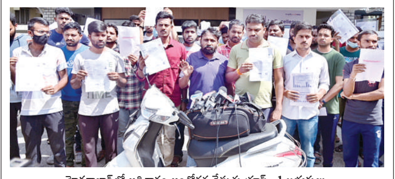
హైదరాబాద్ లో ఆదివారం ఆందోళన చేస్తున్న గ్రామ్ -1 అభ్యర్థులు

విద్యార్థులు ఇతర ప్రదేశాలకు వెళ్లినప్పుడు అక్కడే ఇన్ఫర్మేషన్, వ్యాపారవేత్తలు, ప్రజలతో తెలంగాణ, హైదరాబాద్ అభివృద్ధిపై చర్చించాలన్నారు. ఐఎన్ఐటి కలిసి పనిచేసేందుకు రాష్ట్ర ప్రభుత్వం చూస్తుందని, పెద్దమొత్తంలో వేతనాలు ఇవ్వలేకపోయినా, ఉత్తమ అవకాశాలను కల్పిస్తామని అన్నారు. తెలంగాణ దేశానికి అదర్బంగా నిలుపడమే తన లక్ష్యమని, తెలంగాణ ప్రజాకారులు ఒంటిపక్కలో గోల్డ్ మెడల్స్ సాధించడమే తన ధ్యేయమన్నారు.